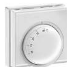
Термостат VR (IP30) 1-4-0101-0038