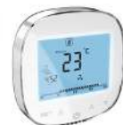
Контроллер ЕС 1-4-2801-0157