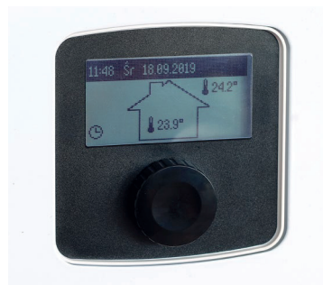
Легкий в использовании регулятор котла

Vitotron 100 может использоваться с любыми типами систем отопления и емкостных водонагревателей. Котел оборудован расширительным баком вместительностью 5 литров и необходимой защитной арматурой. При комбинации котла с емкостным водонагревателем возможно регулирование температуры воды и включение циркуляционного насоса согласно настроенным суточным и недельным программам.