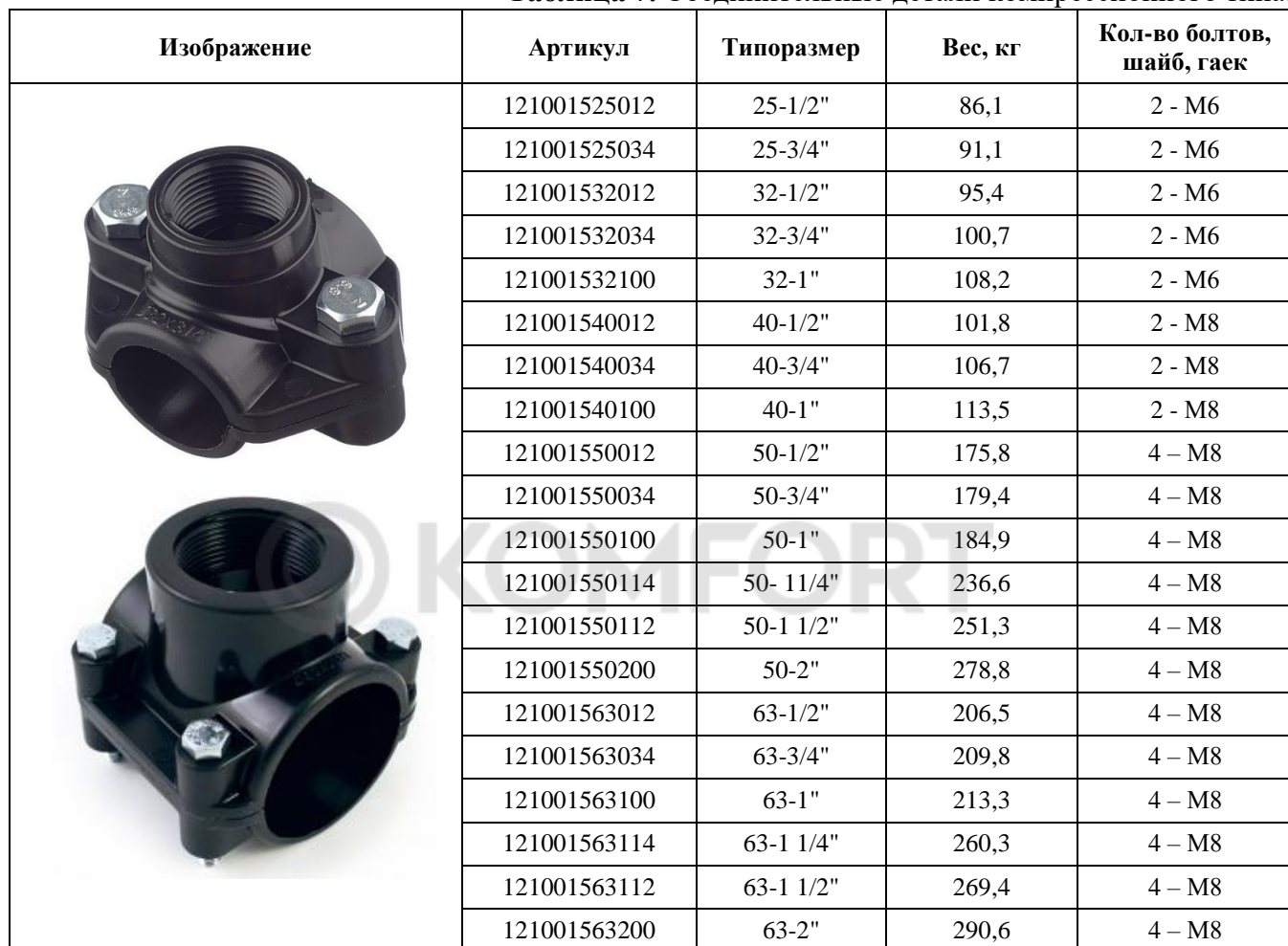
Таблица 7. Соединительные детали компрессионного типа.

Ассортимент выпускаемых седелок указан в таблице 7.