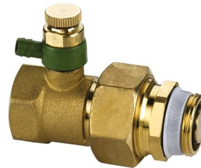
F10305 с наружной резьбой