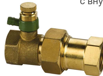
F10306 с внутренней резьбой