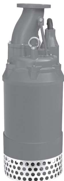
Рис. 43 Насос VDW

Рабочее колесо из высокохромистой нержавеющей стали отличается хорошей производительностью и гарантирует длительный срок службы. Надежное двойное механическое уплотнение вала обеспечивает непрерывную и продолжительную работу насоса и короткие периоды простоя. Встроенная тепловая защита предохраняет электродвигатель от перегрева. Так же насосы оборудованы встраиваемым датчиком наличия воды в масляной камере.