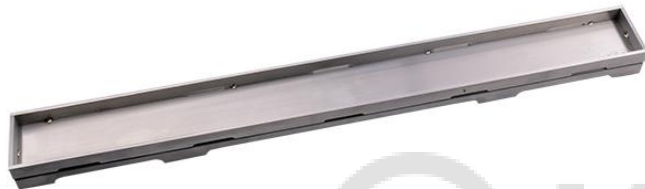
Рис. 4. Решетка HL0531I.

6.3. HL0531I – серия «Индивидуальная», решетка из нержавеющей стали с матовой поверхностью. Данная решетка предназначена для вклеивания в неё мозаики или облицовочной напольной плитки толщиной до 12 мм (включая плиточный клей)