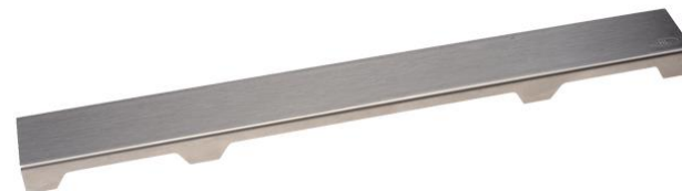
Рис. 2. Решетка HL0531S.

Данная решетка подходит для напольной плитки толщиной до 13 мм (включая плиточный клей)