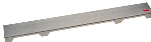
Рис. 3. Решетка HL0531D.