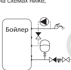
Схема подключения гидроаккумулятора в систему ГВС