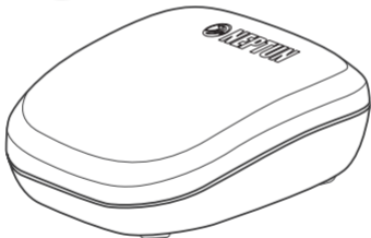
Рис. 1. Внешний вид радиодатчика