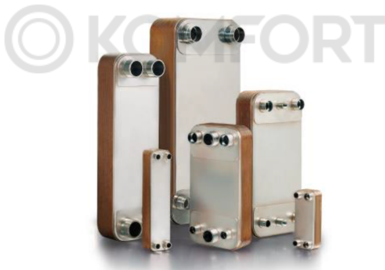
Внешний вид теплообменников пластинчатых типа МРНЕ серии С

Теплообменники пластинчатые типа МРНЕ серии С предназначены для передачи тепловой энергии от одного теплоносителя к другому. Теплообменники пластинчатые типа МРНЕ серии С могут применяться в холодильных установках (компрессорных, абсорбционных), а также в тепловых насосах. В качестве рабочих сред могут использоваться негорючие хладагенты (фторуглероды, хлорфторуглероды, CO 2 ), технические и холодильные масла, вода для технических нужд и систем ГВС, спиртосодержащие растворы.