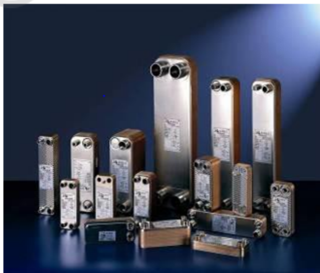
Внешний вид теплообменников пластинчатых типа ВРНЕ

Теплообменники пластинчатые типа ВРНЕ предназначены для передачи тепловой энергии от одного теплоносителя к другому. Теплообменники пластинчатые типа ВРНЕ могут применяться в холодильных установках (компрессорных, абсорбционных), а также в тепловых насосах. В качестве рабочих сред могут использоваться негорючие хладагенты (фторуглеводороды, хлорфторуглеводороды, аммиак, CO 2 ), технические и холодильные масла, вода для технических нужд и систем ГВС, спиртосодержащие растворы.