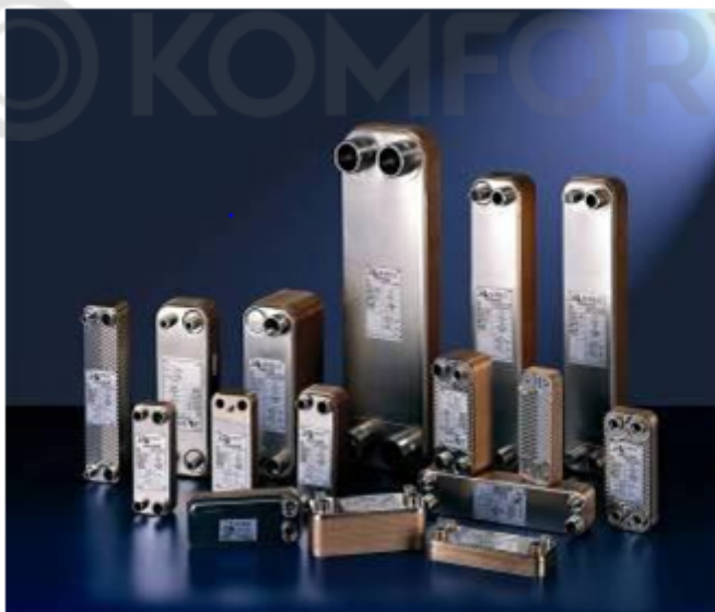
Внешний вид теплообменников пластинчатых типа ВРНЕ

Теплообменники пластинчатые типа ВРНЕ предназначены для передачи тепловой энергии от одного теплоносителя к другому. Теплообменники пластинчатые типа ВРНЕ могут применяться в холодильных установках (компрессорных, абсорбционных), а также в тепловых насосах. В качестве рабочих сред могут использоваться негорючие хладагенты (фторуглеводороды, хлорфторуглеводороды, аммиак, CO 2 ), технические и холодильные масла, вода для технических нужд и систем ГВС, спиртосодержащие растворы.