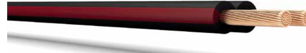
Шнур с параллельно уложенными жилами с поливинилхлоридной изоляцией.

ЕАС 000 "ККЗ" ПуГВнг(А)-LS 1x25 450/750 ТУ 3551-024-38229892-2021 ГОСТ 31947-2012 03.2023 РФ