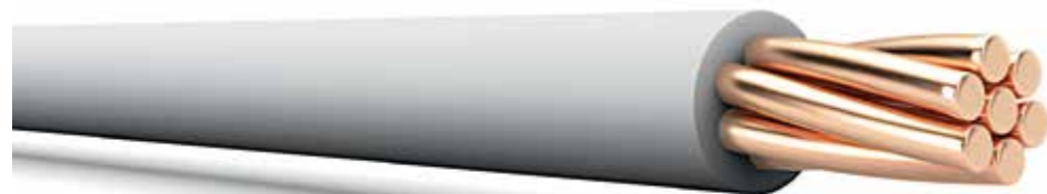
Кабельная продукция по ГОСТ

Провода пониженной пожарной опасности с изоляцией из поливинилхлоридного пластиката для электрических установок на напряжение до 450/750 В включительно. Провода соответствуют требованиям ГОСТ 31947-2012.