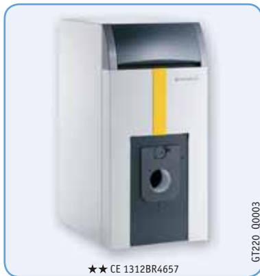
★★ CE 1312BR4657