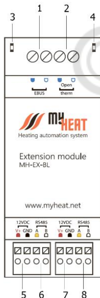
Рис.1. Внешний вид модуля MH-EX-BL