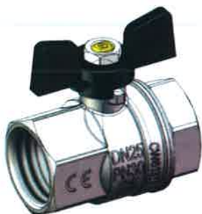
Шестигранный кран серии NEW JERSEY (поставлялся до февраля 2023-го года)