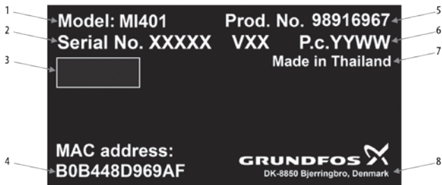
Рис. 1 Фирменная табличка