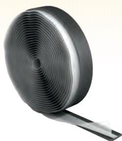
Лента демпферная Energofloor®