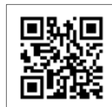
Для получения более подробной информации о технических характеристиках сканируйте QR код.