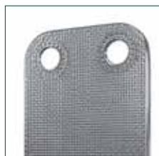
Инновационная конструкция, основанная на микроканальной технологии