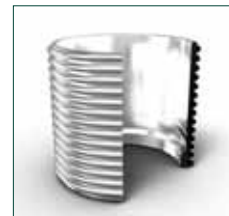
Гибкое соединение «два в одном»