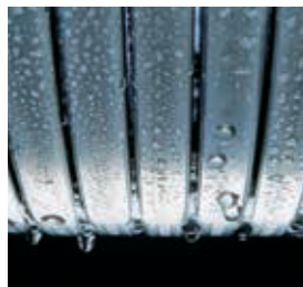
Теплообменник Inox-Radial – эффективный и долговечный