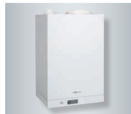
Котел Vitodens 111-W со встроенным 46-литровым емкостным накопителем