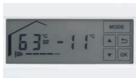
Жидкокристаллический сенсорный дисплей с подсветкой

Настенные газовые конденсационные котлы Vitodens 100-W и Vitodens 111-W управляются при помощи новой жидкокристаллической сенсорной панели управления с подсветкой. Даже в темном помещении легко считывать информацию с дисплея и комфортно пользоваться панелью управления.