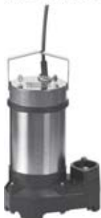
Wilo-Drain TS 40