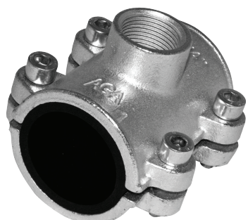
Монтажно-ремонтная обойма OBD (с ВР)