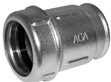
Соединительная муфта типа ИК (вн. резьба)