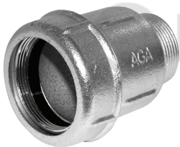
Соединительная муфта типа АК (нар. резьба)