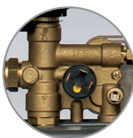
Латунная гидравлическая группа