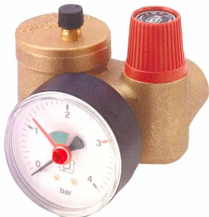
KSG 30 N