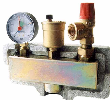
KSG 30 / ISO 2