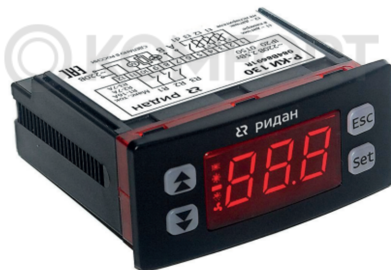
Рис. 1 Внешний вид контроллера

Контроллеры типа Р-КИ управляют холодильным оборудованием на основе заложенной в него программой. Контроллер получает сигналы от датчиков, сравнивает эти показания с параметрами, заложенными в контроллере (уставками) и на основе этого сравнения производит управление (замыкает, размыкает реле). Уставки возможно изменять через дисплей с кнопками управления или по сети ModBus, к которой контроллер подключен при помощи встроенной сетевой карты.