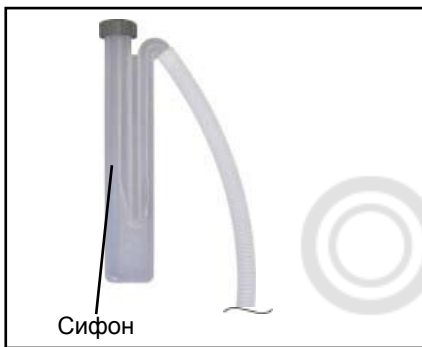
рис.: сифон CGB-75/100

Сифон должен быть заполнен водой и установлен на штатное место.