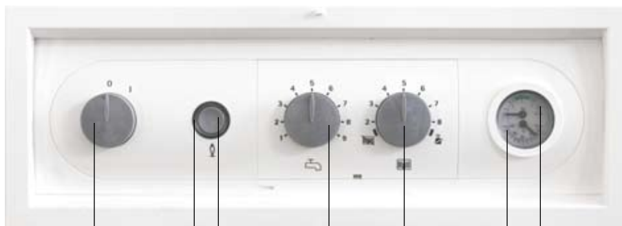
Выключатель Кнопка деблокирования Светящаяся окружность для отображения рабочих режимов Регулятор температуры горячей воды Регулятор температуры воды в системе отопления Температура воды в системе отопления Давление воды в системе отопления (не CGB-75/ CGB-100)