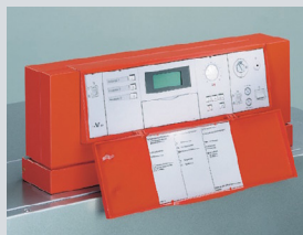
Цифровой регулятор котлового контура Vitotronic 300 GW 2