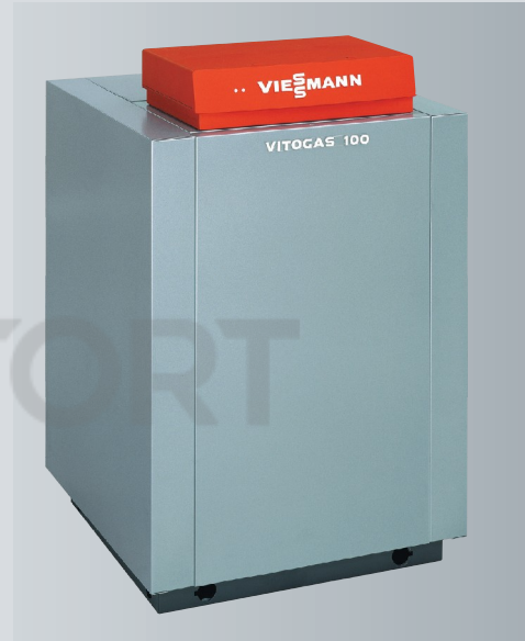
Vitogas 100-F – низкотемпературный газовый водогрейный котел мощностью от 29 до 60 кВт