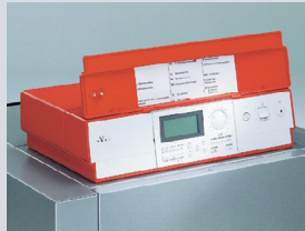
Цифровой регулятор котлового контура Vitotronic 200 KW 5