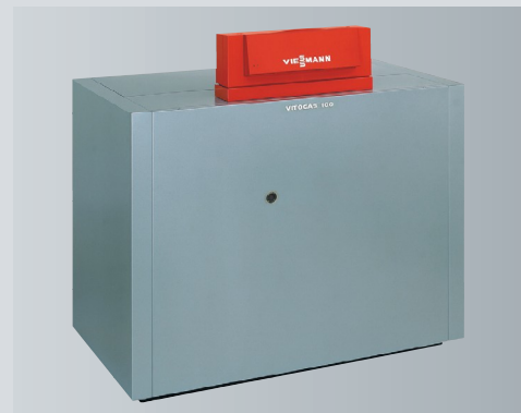
Vitogas 100-F – низкотемпературный газовый водогрейный котел мощностью от 72 до 140 кВт