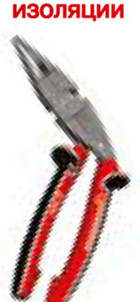
Эргономичные монтажные клещи