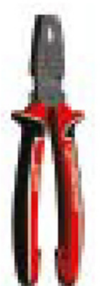
Мультиклещи для удаления изоляции