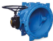
3800 Затвор дисковый поворотный фланцевый с двойным эксцентриком