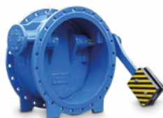
2280 Обратный клапан с наклонным седлом и противовесом