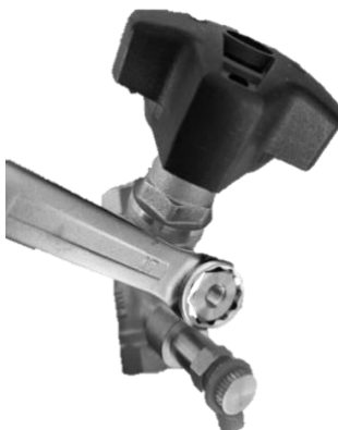
Клапан с адаптером для АРТ