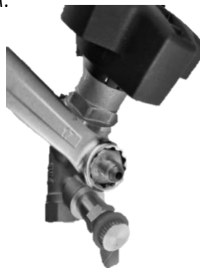
Клапан с адаптером для АРТ-R