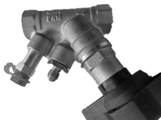
Клапан с адаптером для АРТ-R