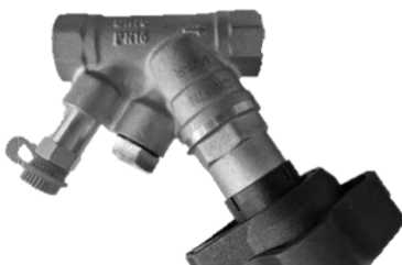
Клапан с адаптером для АРТ