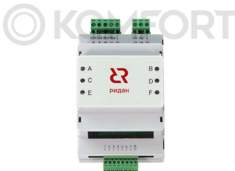
Рис. 1 Внешний вид модуля Р-РМ

Представляет собой печатную плату с расположенным на ней твердотельными реле с выходами на винтовые разъемы в корпусе для монтажа на din-рейку.