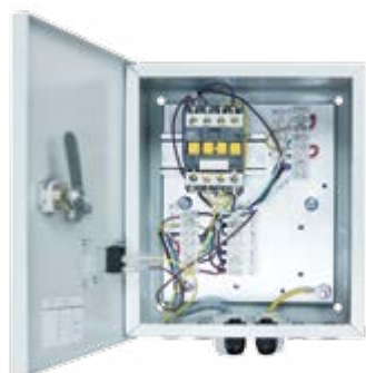
Блок Е Артикул 500038