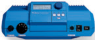
Система управления Logomatic 2000

Если вы хоть раз попытаетесь регулировать отопление с помощью системы обслуживания Logomatic 2000, Вы поймете, что мы понимаем под «простотой обслуживания». Вам не нужно изучать инструкцию по эксплуатации,